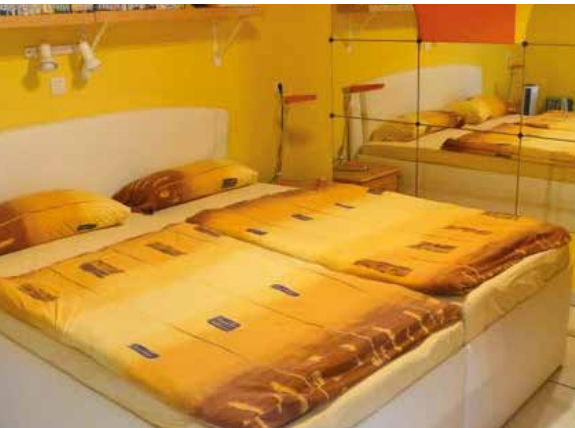
Blick ins 1. Schlafzimmer