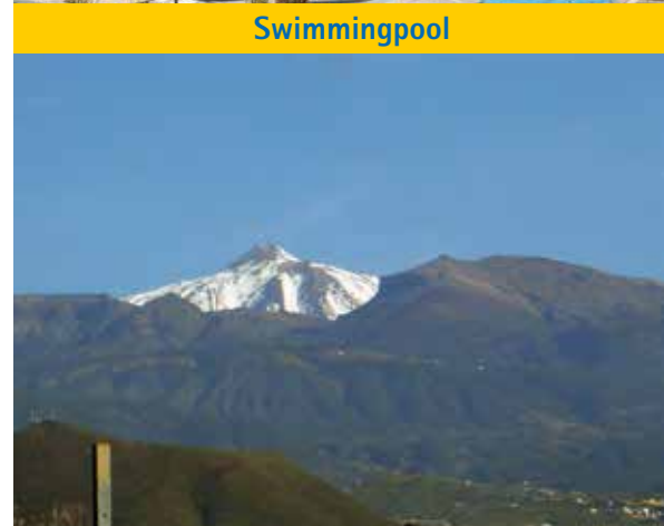
höchster Berg Spaniens der „Teide“