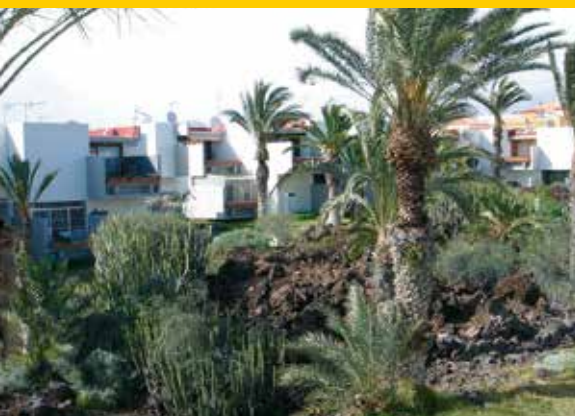
Blick vom Balkon auf den tropischen Garten