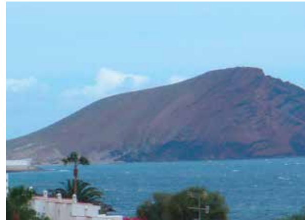
Textil- u. FKK-Strand am Roten Felsen