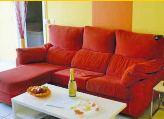
Couch zum Entspannen