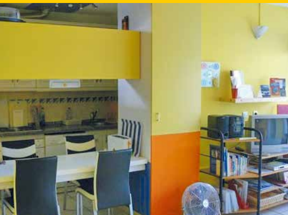
Sitzecke & Fernseher